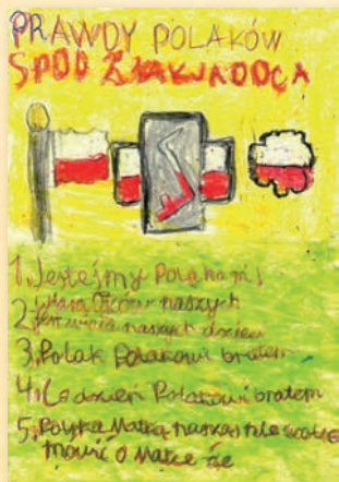
III miejsce – Andżelika Kociemba