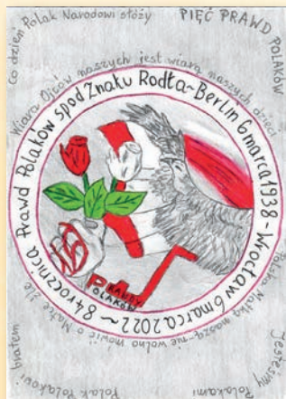
III miejsce – Wiktor Kozdroń