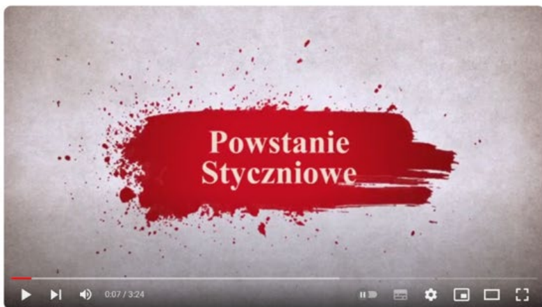
"Każde pokolenie w Polsce zwykło oczekiwać powstania." Powstanie styczniowe

Po upadku powstania listopadowego w 1831 roku Wielka Emigracja starała się stale pobudzać tych, którzy zostali w Polsce do walki o niepodległość. Po trzydziestu latach doszło do kolejnego zrywu narodowo-wyzwoleńczego – powstania styczniowego. Obejrzyj uważnie film, a następnie oceń, czy poniższe zdania są prawdziwe czy fałszywe.