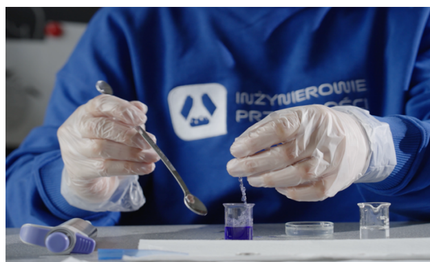
Program umożliwia uczniom wcielenie się w rolę naukowca i przeprowadzenie pierwszych badań naukowych.